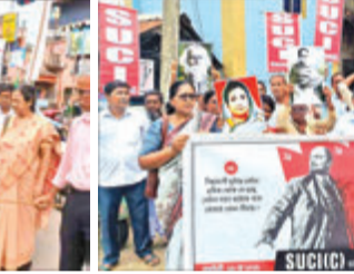
ডায়মন্ডহারবার, দক্ষিণ ২৪ পরগণা