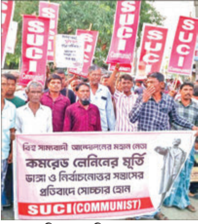
মেরিগঞ্জ ১, দক্ষিণ ২৪ পরগণা