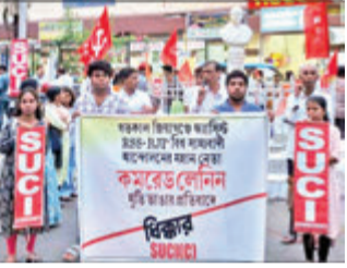
তমলুক, পূর্ব মেদিনীপুর