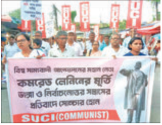
ক্যানিং, দক্ষিণ ২৪ পরগণা

গ্রহণ, ডাক্তারি প্রবেশিকা পরীক্ষায় প্রশ্ন ফাঁসে যুক্তদের শাস্তির দাবিতে ১৩ মে তমলুকের হাসপাতাল মোড়ে শহিদ ক্ষুদ্রিমা বসুর মূর্তির পাদদেশে প্রতিবাদ সভা ও মিছিল সংগঠিত করে এস ইউ সি আই (সি)। নেতৃত্ব দেন ক্ষোভের সাথে বলেন, সম্প্রতি বনগাঁয় কৃষক আন্দোলনের স্মারক ভাঙা হয়েছে, যা অত্যন্ত ন্যাকারজনক ঘটনা। এই হামলার তীব্র নিন্দা করেন তাঁরা।